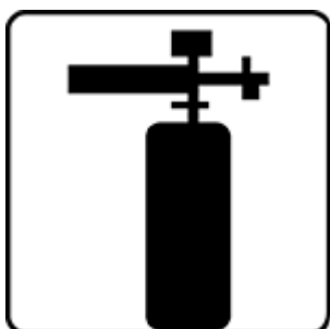
РАЗБАВЛЕНИЕ ДЛЯ ПЕНОКОМПЛЕКТА (1 л) ОТ 140 ДО 220 мл НА 1 л ВОДЫ